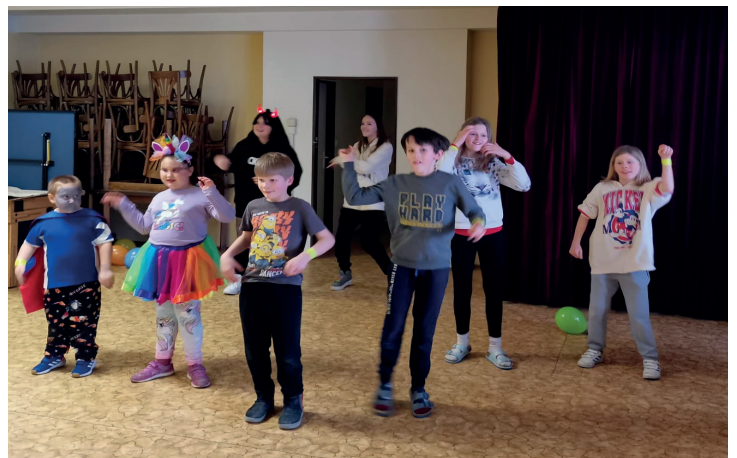
Dětský karneval v hasičárně