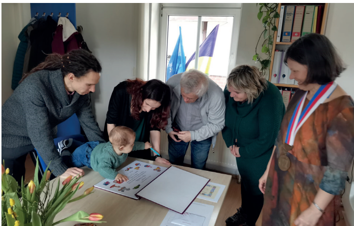
Byla provedena také odborná kontrola pamětních listů