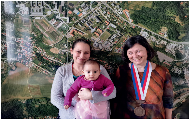
Slavnostní vítání lysolajských občanů...