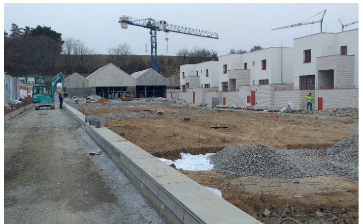
Dlážďení Horního náměstí zahájeno