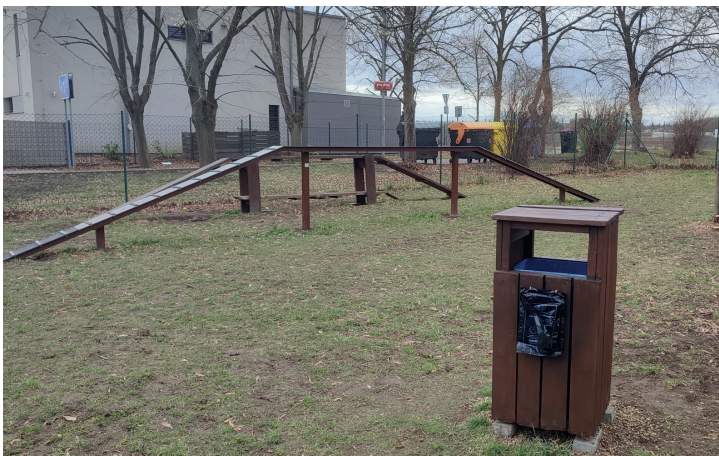
Lysolajský mobiliář prochází renovací