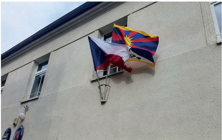
Symbolické vyjádření podpory Tibetu