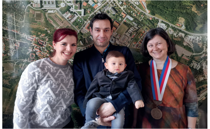
...v rodinném duchu