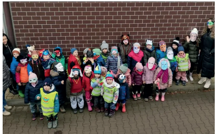
Masopustní průvod naší mateřské školky