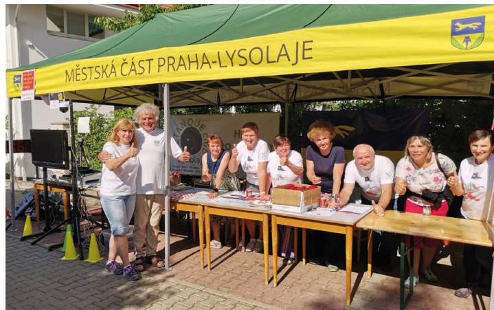
Pořadatelská služba na svých místech