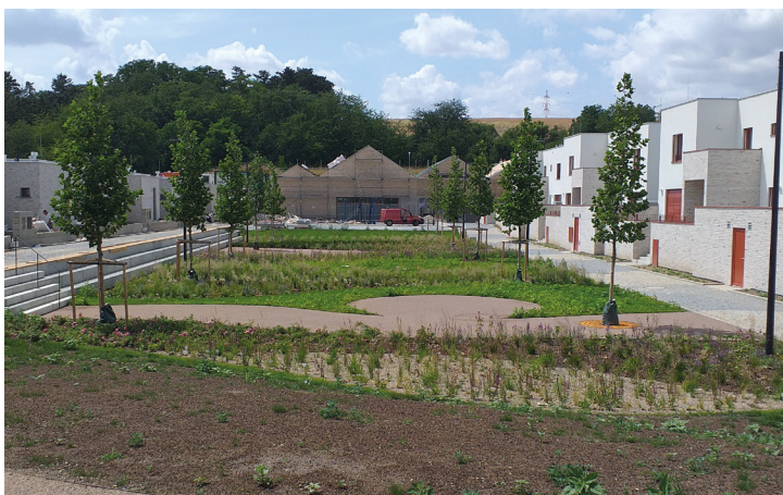
Rozkvetlé Horní náměstí