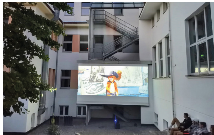
První letní promítání v našem kině