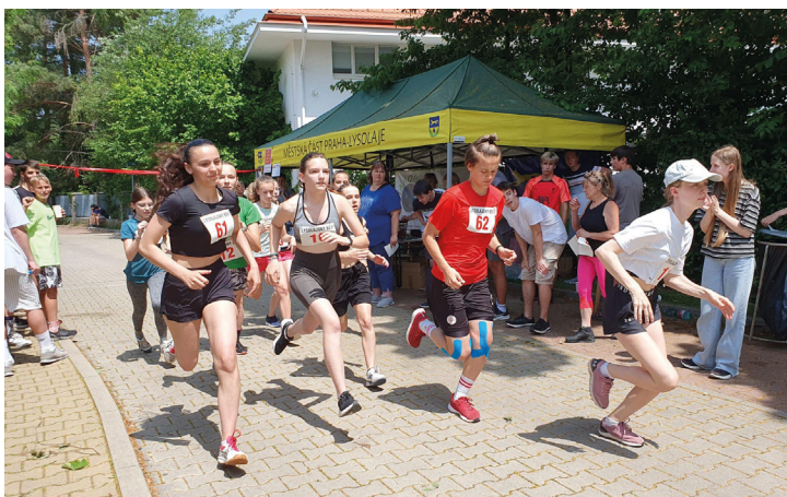
Konkurence běžců z naší ZŠ byla velká