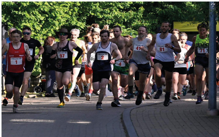
Start 15. ročníku Lysolajského běhu