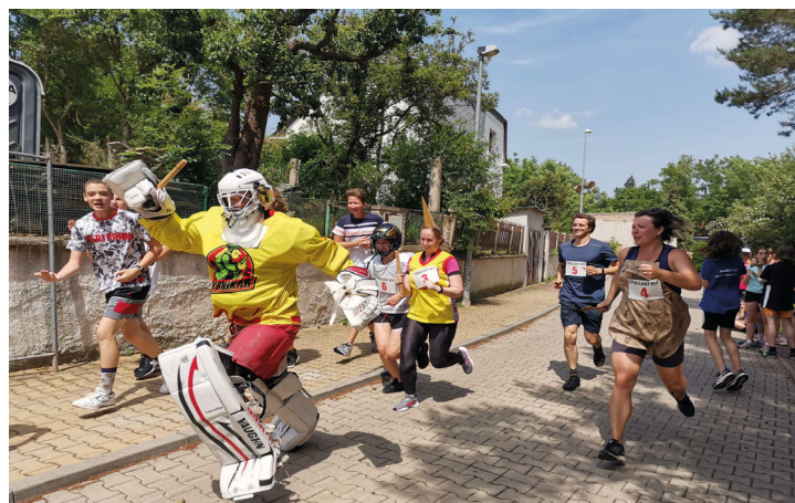
Štafeta učitelů si získala diváky