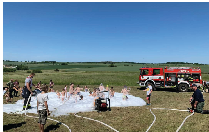
Pěny na hraní není nikdy dost