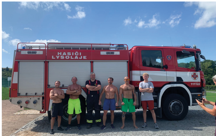
Pořadatelská služba na svých místech