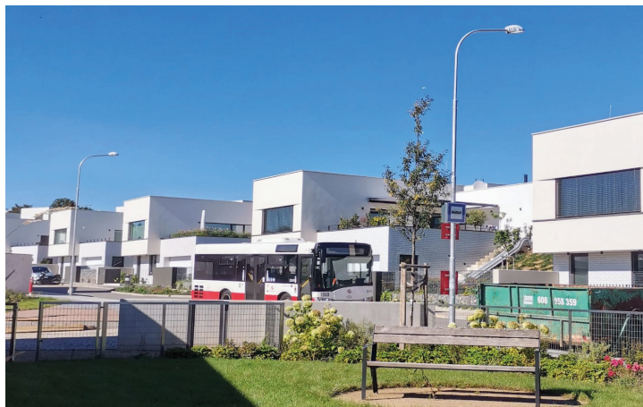
Nová zastávka autobusu č. 160 Horní náměstí