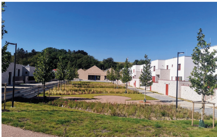
Horní náměstí v podzimmích barvách