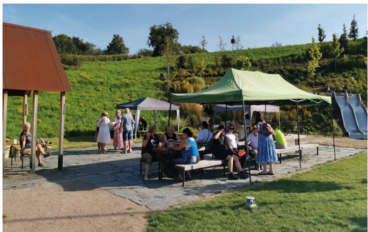
Lysolajské babí léto tentokrát v pískovně