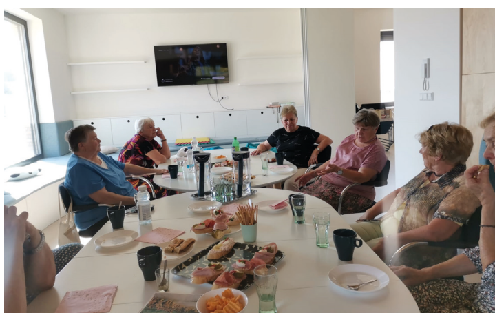
Setkání členů KLAS, každý čtvrtek v KC Cihla