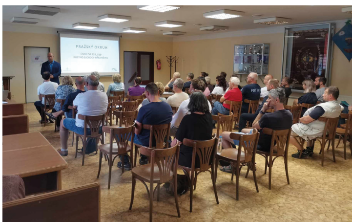
Představení záměru výstavby silničního okruhu v hasičárně