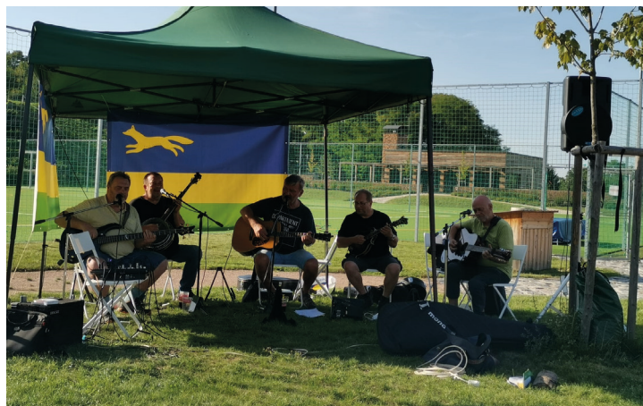
K poslechu hráli jako tradičně místní Docenti