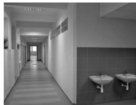
V chodbě nově zrekonstruovaného přízemí školní budovy