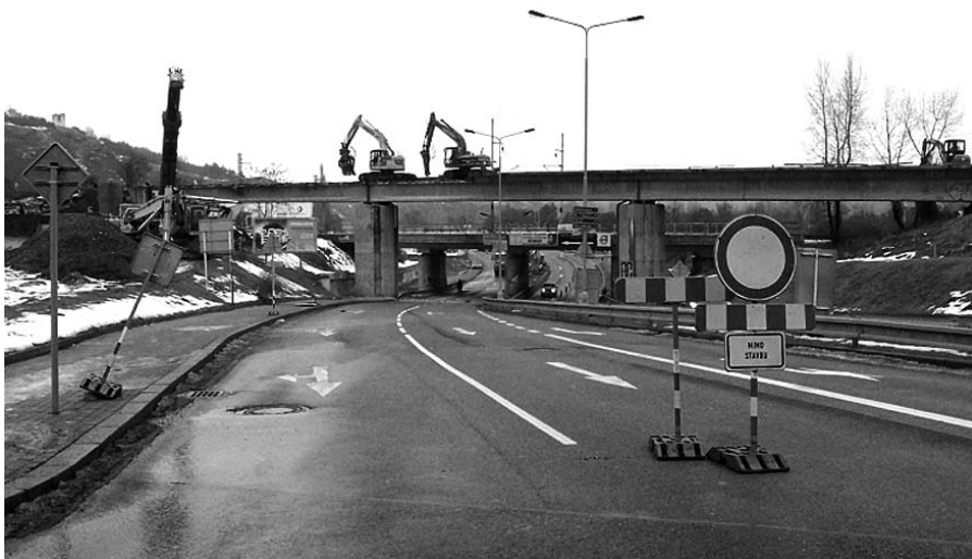
Staveniště nové tramvajové smyčky v Podbabě

• Často kritizovaná stavba nové tramvajové smyčky v Podbabě skutečně začala. Momentálně stroje odstraňují železniční most, po kterém zajižděly vagóny vlečky do podbabské sladovny. Tramvajová smyčka by měla být dokončena do června tohoto roku, vlaková zastávka v Jednořadě ulici by měla být hotova později. Celková suma na rekonstrukci bude činit nejméně 280 milionů korun, které hodlá investor pokrýt z větší části z fondů Evropské unie.