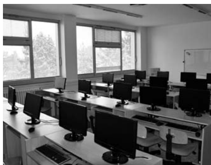
Nově zkolaudovaná počítačová učebna v podkroví školy