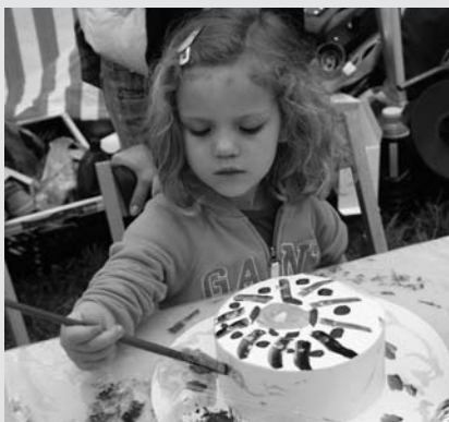
Bude můj klobouk nejkrásnější?