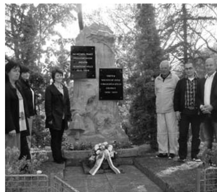
Uctění památky občanů Lysolaj padlých za první světové války a v letech okupace.

Jubilantům upřímně gratulujeme. Přejeme vše nejlepší a hodně zdraví do dalších let.