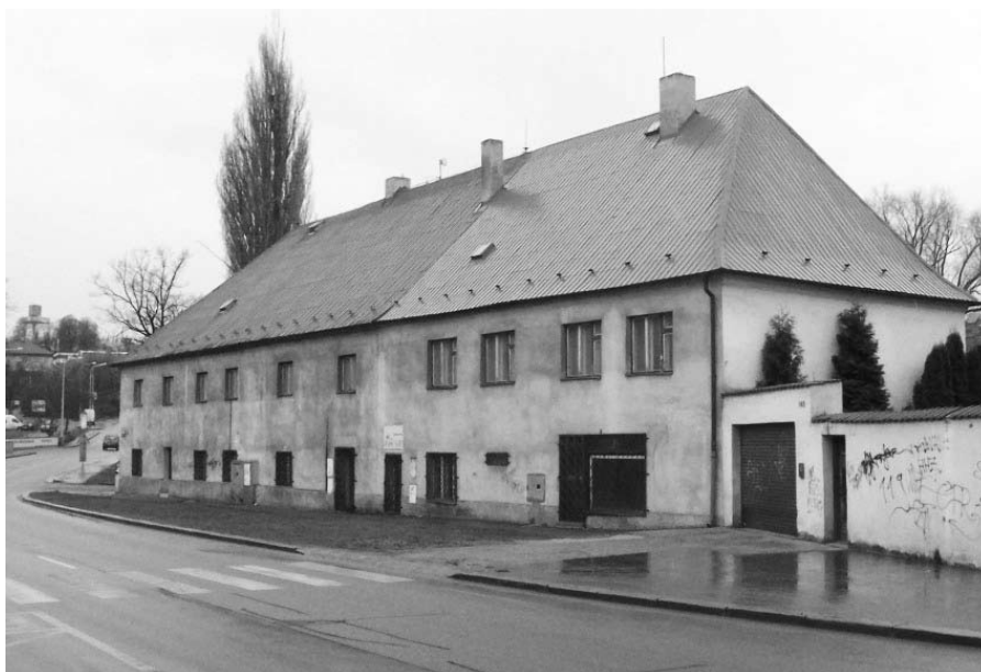
Starobylá hospoda U Maříků stojí vedle známé hospody Na Nové. Snímek je z roku 2008, v té době už u Maříků sídlila stavební firma.