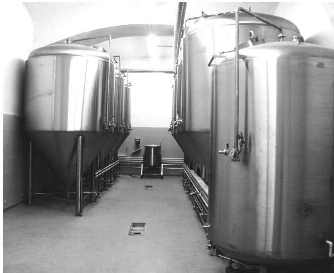
Moderní technika ve starém sklepení