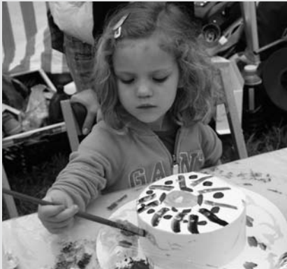
Bude můj klobouk nejkrásnější?