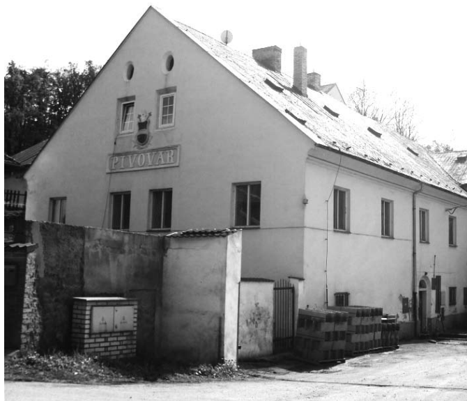
Budova Únětického pivovaru