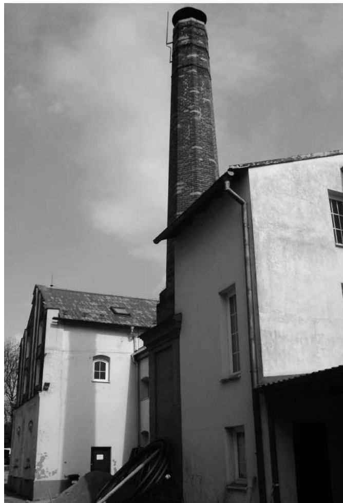
Pivovar z jiného úhlu