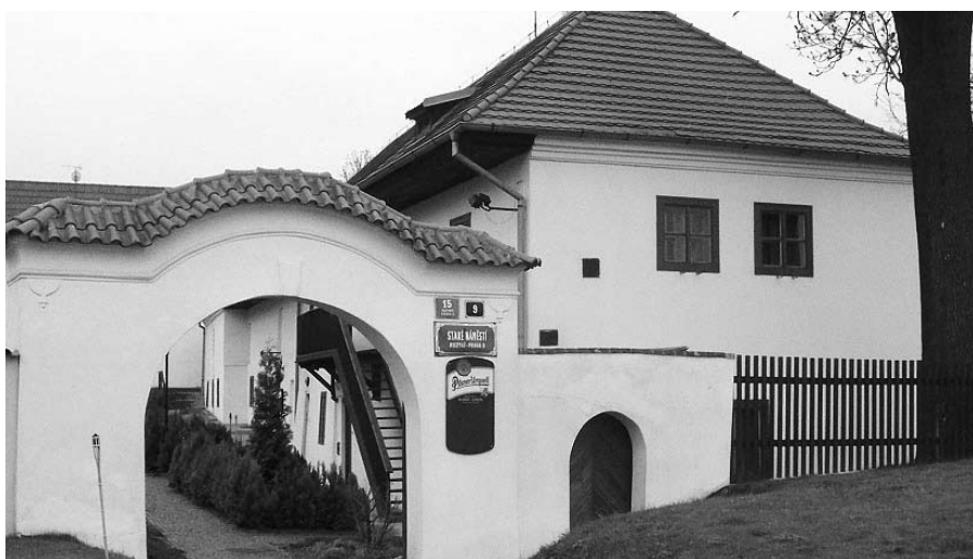
Kubrův statek (2008)