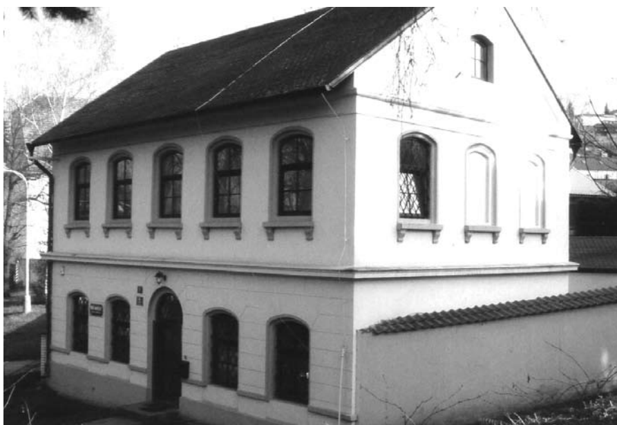
Usedlost č. 4 (2002)