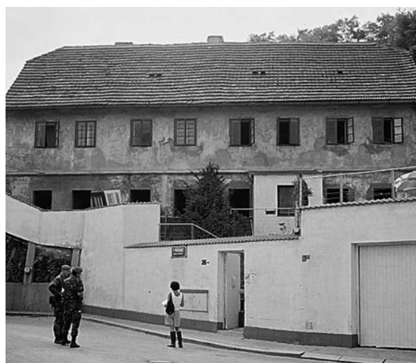
v srpnu 2002