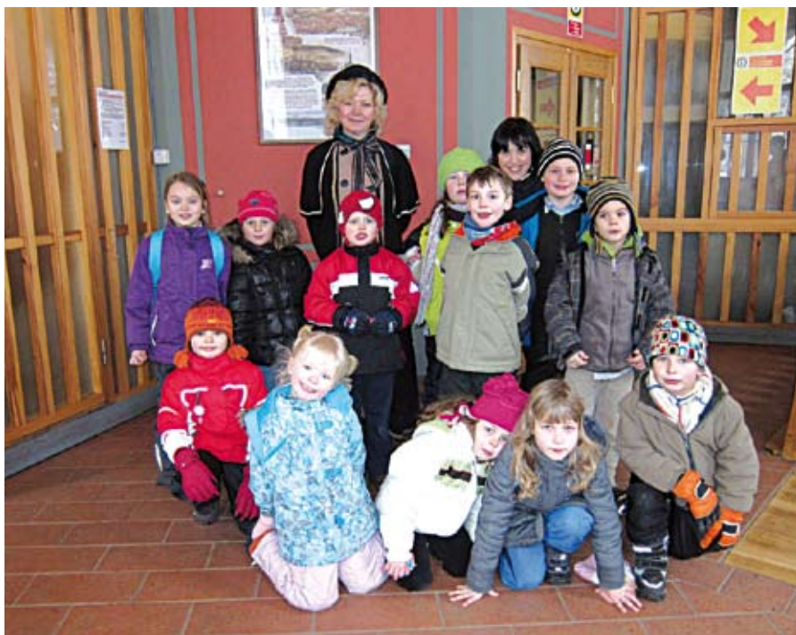
Všichni uspěli na výbornou

Druhá třída navštívila 31. ledna Městskou knihovnu na Mariánském náměstí. Čekala nás ochotná a milá paní knihovnice, která nás provedla dětským oddělením knihovny, dětem řekla pár slov o historii knihovny a zasvětila je do poslání knihoven a způsobu vypůjčování knih. Děti jí předaly své dárky, namalované pohádkové bytosti, které paní knihovnice v dětském oddělení knihovny hned vystavila. Potom si děti procházely knihovnu a prohlížely různé tituly knih.