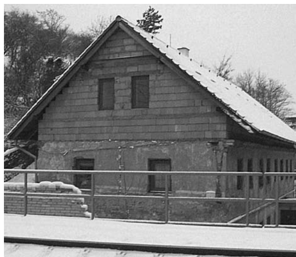
v listopadu 2010