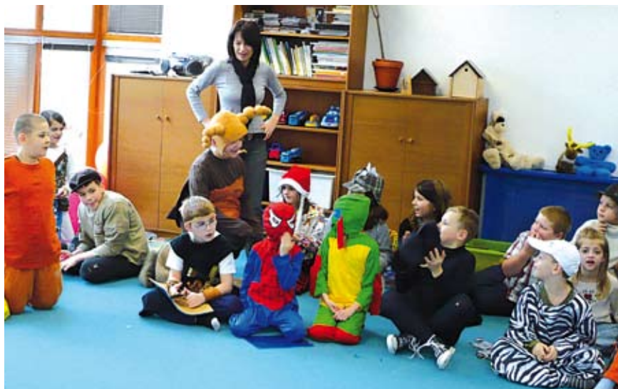
Kostýmy inspirované českou i světovou klasikou