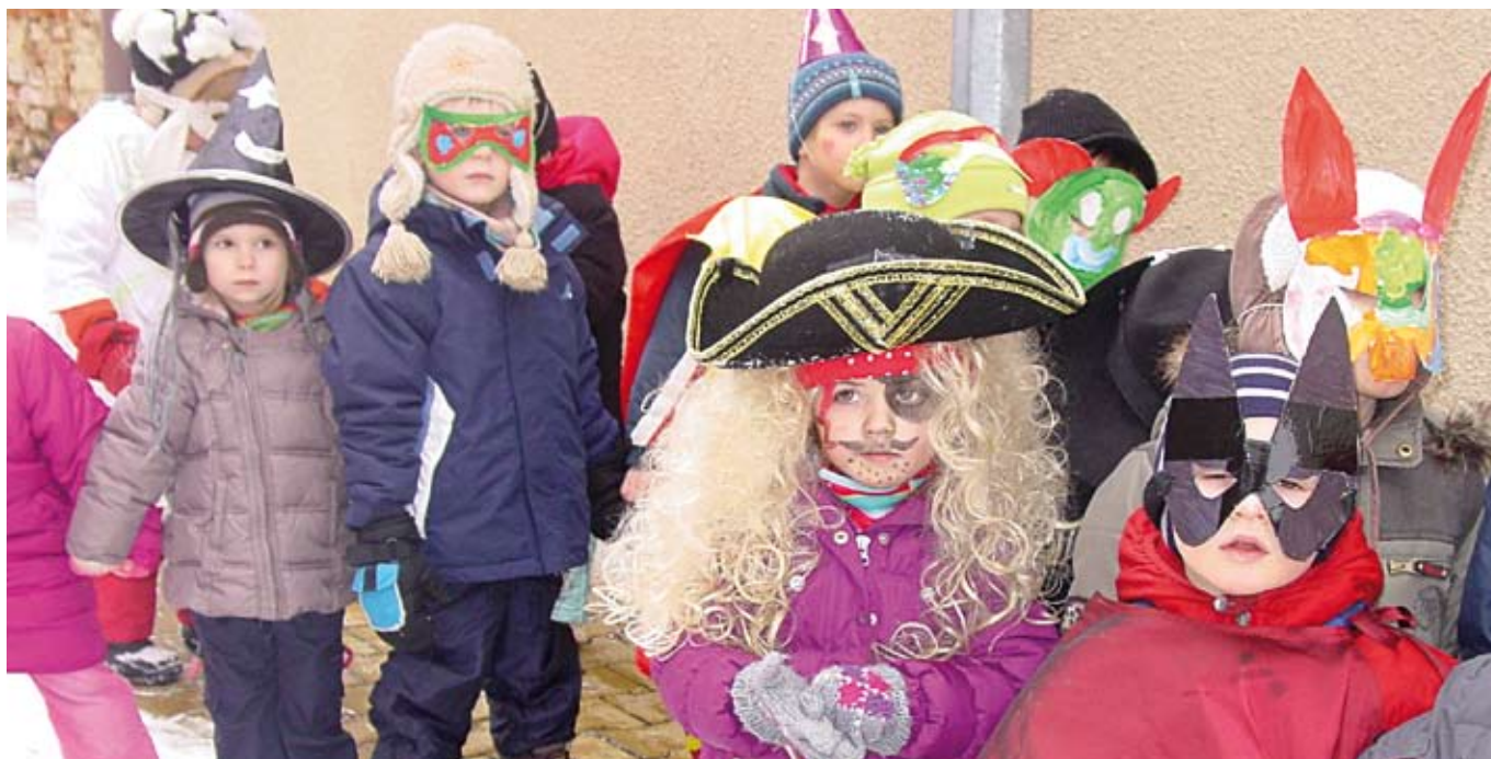
Masopust v Lysolajích