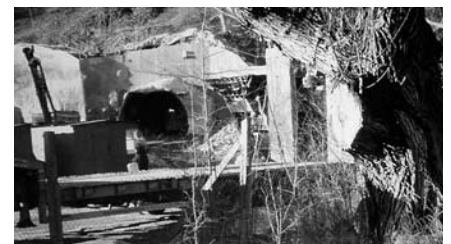
Z téhle hory rytíři zřejmě nevyjdou