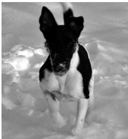
Jménem lysolajské psí smečky děkuji, že pro nás uklízíte.

Právní předpis hl. m. Prahy č. 18/2004 je Obecně závazná vyhláška, kterou se mění obecně závazná vyhláška č. 23/2003 sb. hl. m. Prahy, o místním poplatku ze psů, s datem účinnosti 1. 1. 2005. Poplatek je stanoven na území hl. m. Prahy (tedy i v naší městské části) na 1500 Kč za jednoho psa, za druhého a dalšího pak 2250 Kč ročně, žije-li pes v bytovém domě. Je-li přihlášen pes v rodinném domku, platí jeho držitel 300 Kč, za druhého a dalšího psa pak 600 Kč ročně. Platby jsou zproštěny oso-